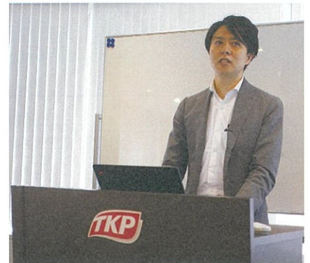
サン共同税理士法人 (東京都港区) デロイトトーマツ税理士法人(シニアマネージャー)退職後、2016年よりサン共同税理士法人(東京都港区)の代表社員に就任。Web集客と自社開発による業務管理ソフトウェアやRPAを使ったIT戦略を強みとしている。また、会計事務所のM&Aに積極的に取り組み、開業後3年間で八王子、板橋、飯田橋の3拠点の会計事務所を承継している