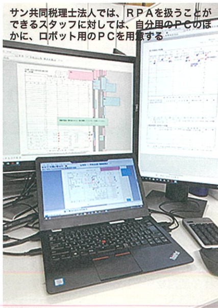
サン共同税理士法人では、RPAを扱うことができるスタッフに対しては、自分用のPCのほかに、ロボット用のPCを用意する

※ほかにロボットが得意な分野の業務で、新たに 取り組み始められる業務はないかを検討する